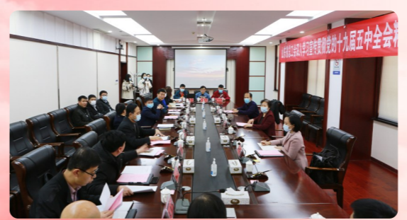
12月23日,省总工会党组副书记、副主席魏丽做主题分享

组织干部职工及时学。万达集团各下属单位迅速行动,进会议室办公室、进车间班组、进员工宿舍,多方式、多渠道、全方位抓好干部职工及时学习领会全会精神,迅速掀起了学习宣传党的十九届五中全会精神的热潮。