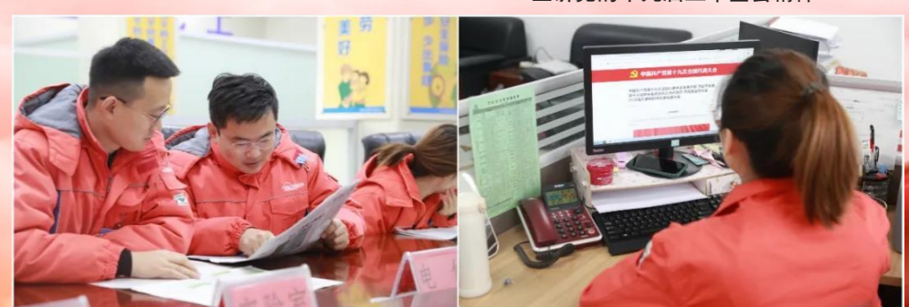
干部员工利用工作之余学习党的十九届五中全会精神