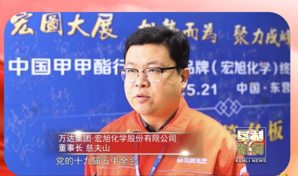
万达集团 宏旭化学股份有限公司 董事长 慈夫山 党的十九届五中全会