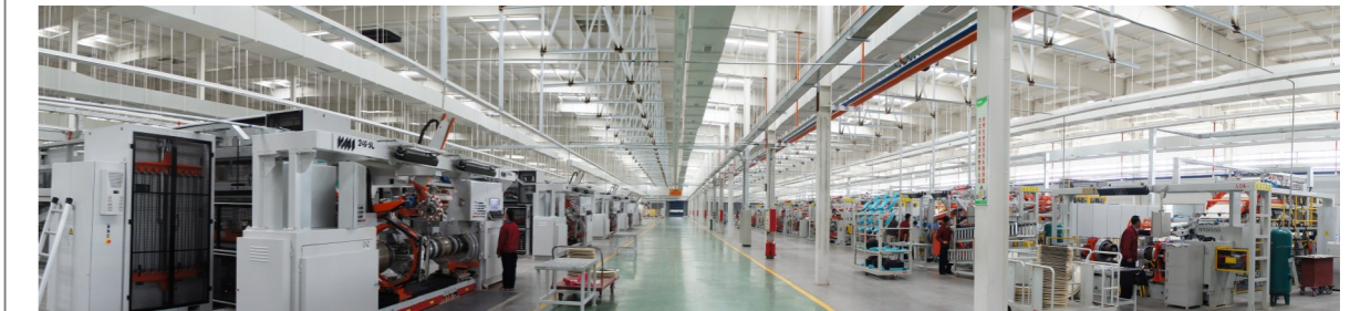
万达集团1500万条年半钢胎项目车间