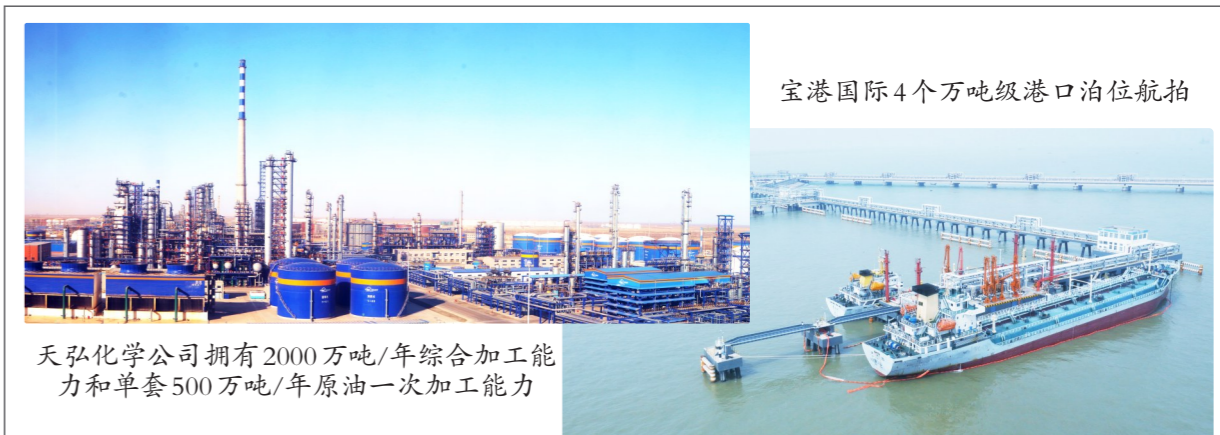
天弘化学公司拥有2000万吨/年综合加工能力和单套500万吨/年原油一次加工能力

同时,公司拥有中国名牌1个,中国驰名商标2个,20多个省级以上名优品牌,名牌总位数居全省民营企业前十位,并荣获山东省省长质量奖,构建起了一套万达特色的