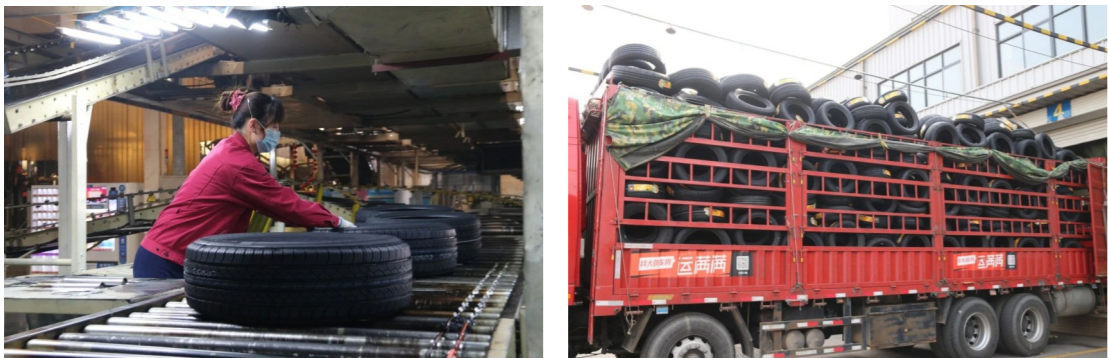
各单位开足马力,赶制订单并陆续发货

本报讯 近日,万达集团按下复工复产“加速键”,各单位一手抓防疫,一手抓生产,疫情防控与生产经营同步有序推进。