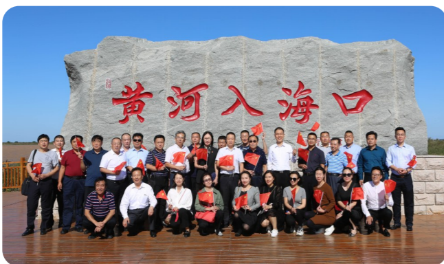
企业家们游览美丽的黄河入海口

山东省民营企业家协会是经中共山东省委统战部 and 山东省民政厅批准注册,由我省有代表性的民营企业家自愿组成的具有法人资格的非营利性社会组织,系山东省工商业联合会的直属协会,受省委统战部、省工商联、省民政厅直接领导和管理。她是党和政府联系我省民营企业的桥梁和纽带,是省委、省政府管理民营企业的助手,是我省民营企业家之家。