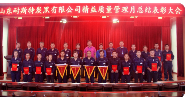
山东耐斯特炭黑有限公司精益质量管理月总结表彰大会