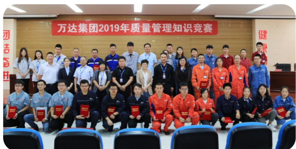
“庆祖国70华诞”质量知识竞赛活动