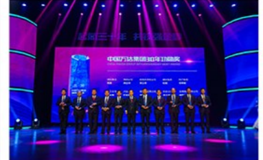
万达集团30年功勋奖