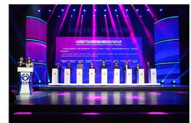
万达集团全球战略签约仪式(2轮)