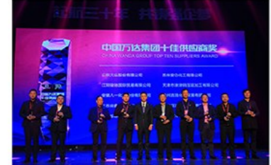
万达集团十佳供应商奖