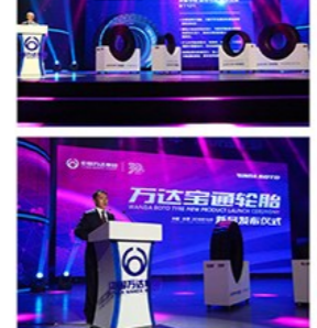
万达宝通轮胎新品发布仪式