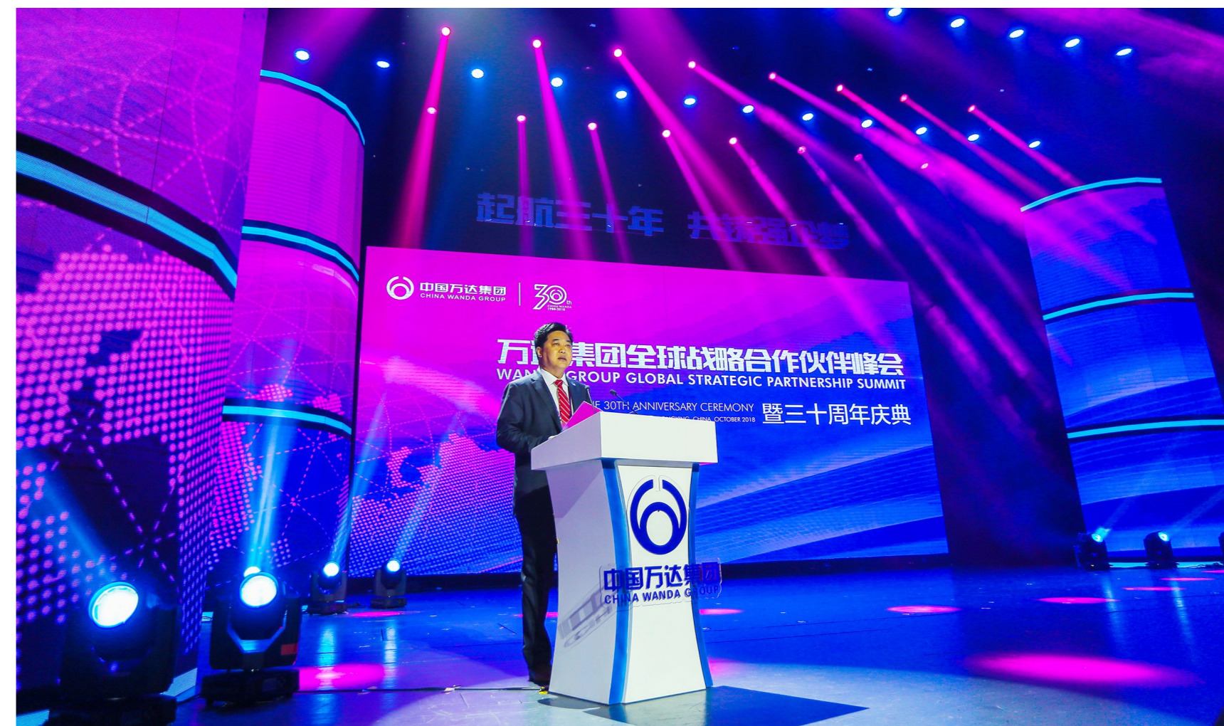
万达集团全球战略合作发布仪式

本报讯 (集团办公室刘玮)10月31日,山东东营雪莲大剧院流光溢彩、宾朋云集、气氛热烈。来自全球近30个国家、500多家合作伙伴、30多家主流媒体、以及万达千名员工代表逾600人齐聚一堂,共同参加“起航三十年 共铸强企梦”——万达集团全球战略合作伙伴峰会暨三十周年庆典,共同畅叙友谊、深化交流、加强合作、共谋发展。 凝聚产生力量,携手共创辉煌。峰会上,万达集团与沙特埃克弗耶夫石油、艾瑞宾汽配公司、中化石油等来自国内外的16家单位进行了战略合作框架签约,并向互联互通、携手共进的供应商和经销商代表颁奖,感谢他们的鼎力支持和至诚关怀。万达宝通轮胎在峰会上发布了4款新产品,并分析了当前全球轮胎市