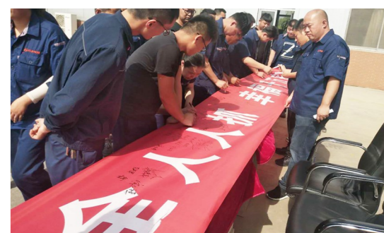
安全生产月启动仪式