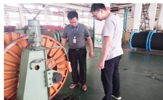
公司内部组织安全隐患排查