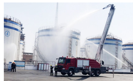
罐区着火消防逃生应急演练活动