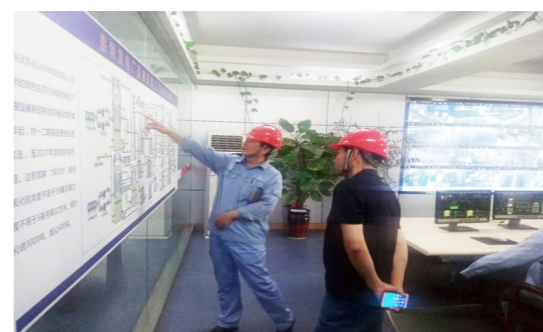
“走出去”学习安全环保管理经验