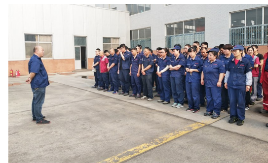
公司内部职工安全操作技能培训