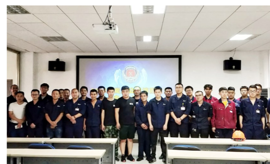
消防及应急器材知识培训活动