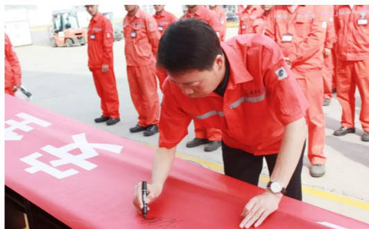
安全生产月启动仪式