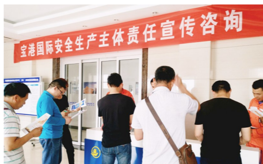
安全生产主体责任宣传咨询活动