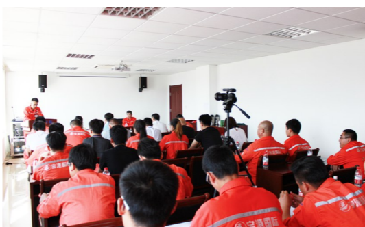
安全生产月演讲比赛