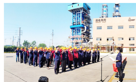
安全生产月启动仪式