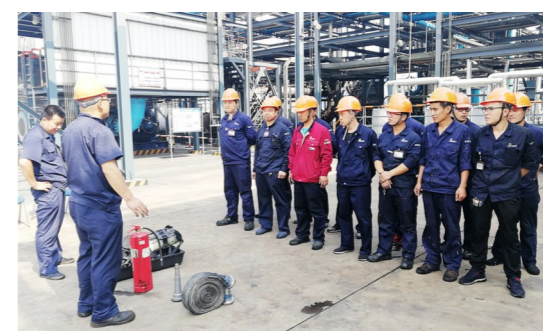
炭黑尾气中毒无脚本现场应急演练