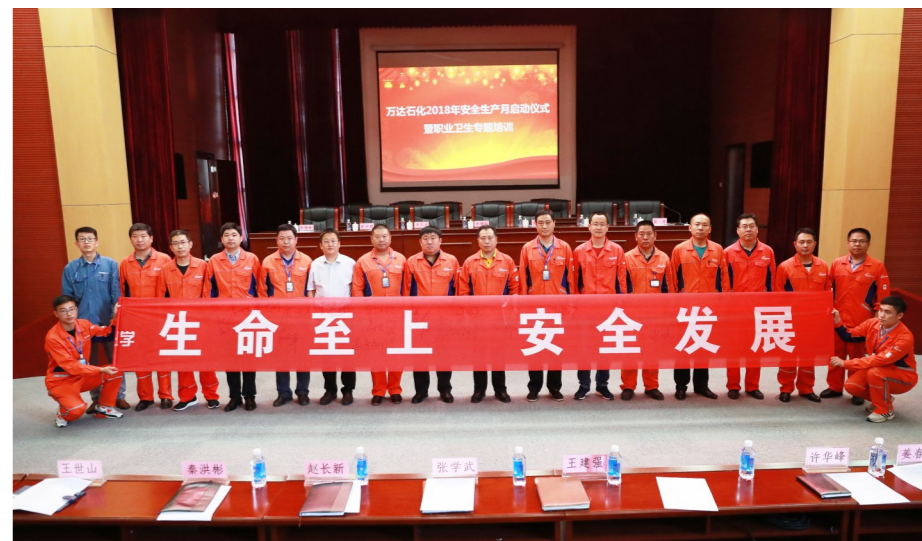
石化集团“安全生产月”启动仪式

石化集团积极贯彻“生命至上 安全发展”的活动方针,通过开展安全生产宣誓、专题培训、应急演练、安全隐患大排查等系列活动,在全公司凝聚起弘扬安全发展的理念,进一步提高全体员工的安全生产意识,坚决执行“安全第一、预防为主、综合治理”的方针,为石化集团健康跨越发展提供安全稳定的发展环境。