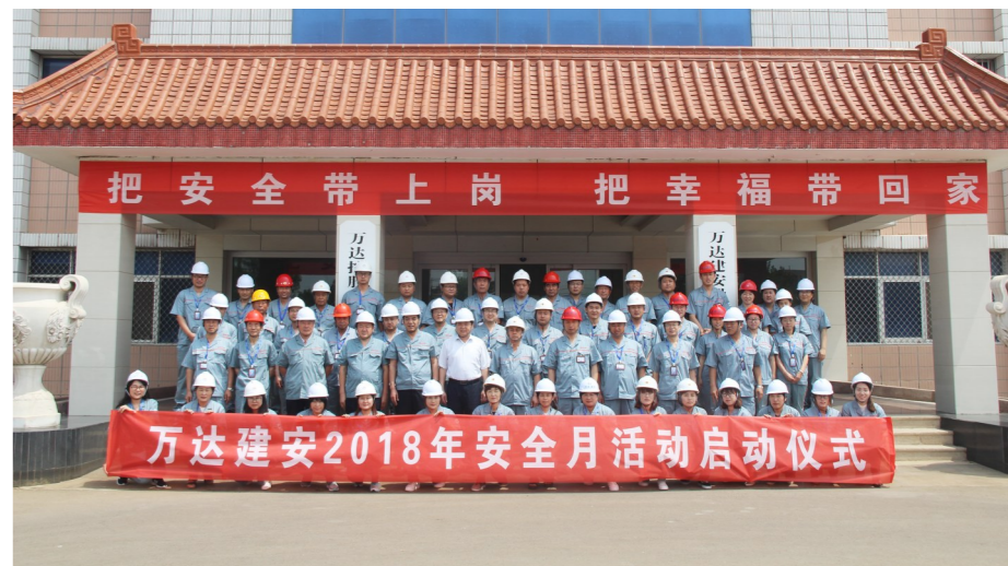
建设集团“安全生产月”启动仪式