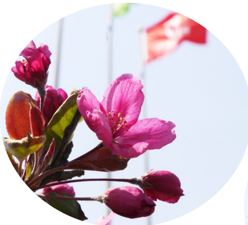
□图/石化集团 刘志刚