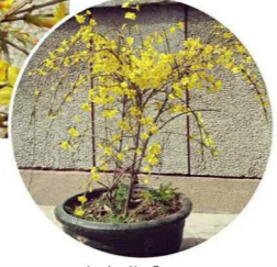
J A N E