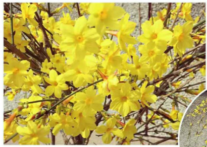
花恋·别册 beautiful flowers

暮色笼罩着群山 只见雁鸟悠然飞过 追逐眺望 如画如烟 每一处形态都是大自然奇妙的展示 每一秒变换都是大自然给予世界的爱 云烟缭绕,美景流连 汇集成思维中最深沉的想法 凝聚成回忆中最真挚的感动 迎着东方吐白 承接即将到来的黎明 它丝毫不逊色于日出的壮丽 看它与地平线相吻 留下一片耀眼的红妆 所谓万丈深渊下去 也是鹏程万里