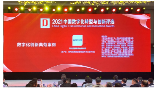
万达集团入选《2021中国数字企业白皮书》,并荣获2021中国数字化转型与创新典型案例奖

年终岁尾,东营市组织重大项目现场观摩活动,检验一年来新旧动能转换和产业转型升级成果。12月15日,2021年东营市重点项目观摩走进东营港经济开发区。此次东营港经济开发区共有七个项目接受观摩,万达集团的4×10万吨液化码头及配套管廊陆域工程一期项目、45万吨/年丙烷脱氢项目、阿托伐他汀钙医药中间体项目,以及与中石化合资的26万吨/年丙烯腈项目等4个项目在重点项目观摩之列。