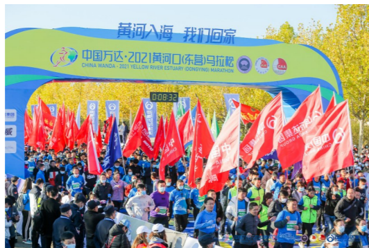
携手东马11年 万达荣耀相伴 中国万达?2021黄河口(东营)马拉松激情开赛

9月,国家市场监督管理总局等20个部门联合开展2021年全国“质量月”活动。中国质量检验协会积极响应2021年全国“质量月”活动号召,组织开展了“企业质量诚信倡议”专题活动。在本次中国质量月活动中,万达宝通轮胎凭借完善的生产管理系统、优异的产品品质、消费者的一致好评及品牌美誉度,荣膺“全国质量诚信标杆企业”这一“国字号”荣誉。这不仅是对万达宝通品牌的认可,更是万达宝通轮胎一如既往秉承质量为先的责任!