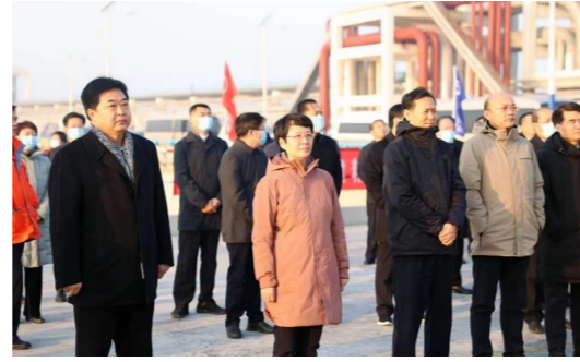
东营市举行2021年全市重点项目观摩,万达集团四个项目接受“检阅”

10月17日上午7:40分,中国万达·2021黄河口(东营)马拉松赛开赛。每个万达人心中都有一个马拉松。2010年以来,中国万达集团与东马相伴同行,已连续11年全球冠名赞助黄河口(东营)马拉松赛,与社会各界共同见证和推动了赛事的发展壮大。伴随着赛事规模和影响力持续提升,“东马”已深入人心,并成为东营一张靓丽的城市名片。“挑战自我,超越极限”的马拉松精神一直激励着万达人不忘初心、砥砺前行!