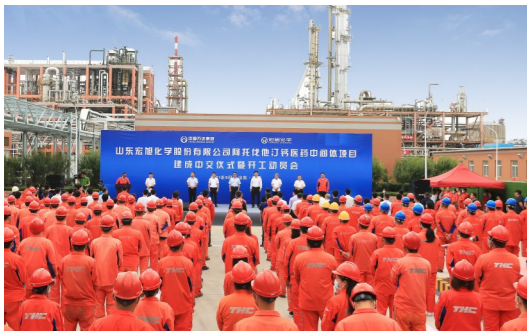
万达集团建成全国最大阿托伐他汀钙医药中间体生产基地

9月17日,宏旭公司阿托伐他汀钙医药中间体项目建成中交,打破了国外医药公司技术垄断,投产后单套生产规模为国内最大,年产量占据国内细分市场75%份额;项目后期还可继续延伸产业链,生产附加值更高的A8产品,届时,万达集团将成为国内唯一一家能进行A1→A8全产业链生产的企业。