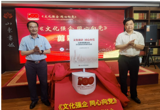
山东省首本民营企业文化书籍《文化强企同心向党》出版发行

阿托伐他汀钙医药中间体项目建成中交,是万达集团布局高端精细化工产业链,从源头增强核心竞争力和综合实力的重要举措,对推动石化产业技术创新纵深发展,加速公司产业升级、推动高质高效发展,持续完善公司“石化橡胶一体化”产业链条具有深远的影响。