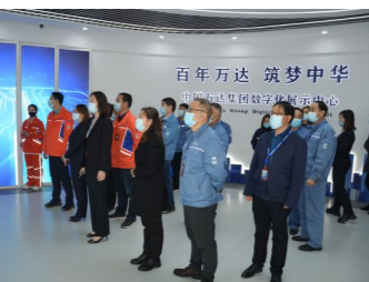
万达数字化企业展厅