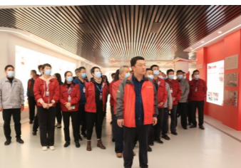
“红色引擎 创业先锋”党建展厅