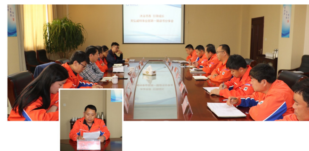
5月10日,威特公司开展了第一期读书分享活动。分享会上,14位分享人分享了《思考,快与慢》、《管理的实践》、《大流感》等多部经典书籍,畅谈了自己的阅读感悟,他们或深情、或慷慨、或质朴的讲述,结合自己的实际工作,把从书中的感悟、成长与大家进行了分享。