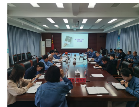
感悟书香致远 汲取前进动力 万达化工开展读书分享交流活动