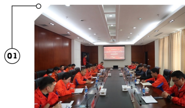
5月13日 万达石化集团组织开展“党史学习教育暨读书分享主题培训”活动