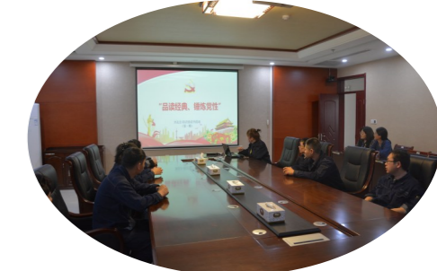
品读经典 锤炼党性 兴达公司举行读书交流分享会

5月12日下午,兴达公司各部门优秀职工代表在会议室举行了读书交流活动。本次读书交流的内容是结合“党史教育活动”及一个月以来所读书的感受和体会。主要分享了《习近平的七年知青岁月》读书心得,了解了总书记刻苦读书学习的故事,学习了总书记“苦其心志、劳其筋骨、饿其体肤、空乏其身”的历练故事。