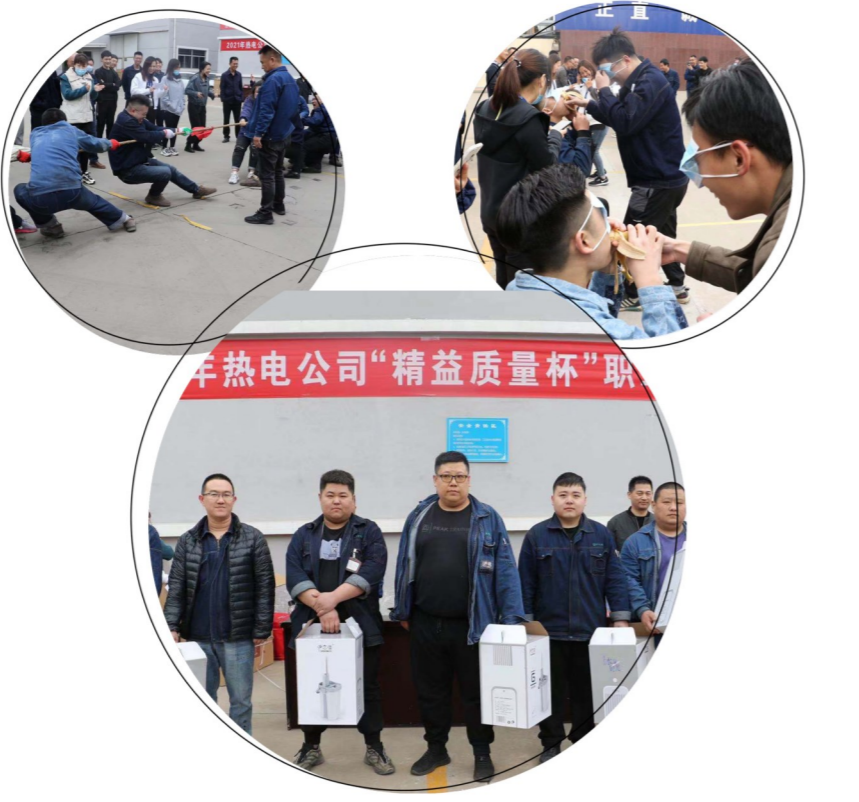
4月30日 热电公司开展“精益质量杯”职工趣味运动会