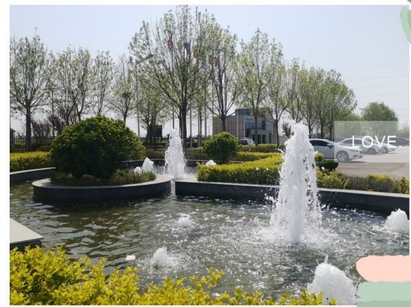
LOVE 绿水青山就是金山银山