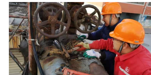
垦利区财政局管线刺漏抢修