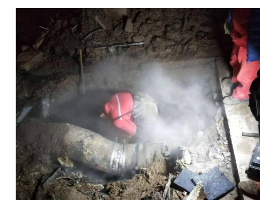
茗瑞华府一级网管线抢修