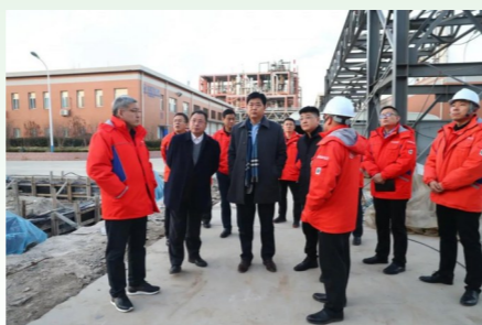
凝心聚力谋发展 砥砺奋进谱新篇

尚主席指出,临近年底,各项工作交织叠加,越到这个时候越麻痹不得,各单位要切实抓好生产运营,全力冲刺打好年底收官战,圆满完成年度任务目标;要狠抓安全环保不放松,密切关注天气变化,实现企业安全稳定发展;要加快项目建设,优化企业布局,争取早建成、早投产,厚植企业发展新优势,助推集团公司转型升级。