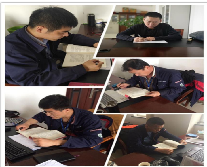
2020年5月,东营港供应公司部分员工读《细节决定成败》。