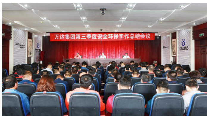
度执行、培训效能及应急能力提升等方面进行了针对性的安排部署。会议由集团战略与科技管理

万达集团安委会副主任、董事局董事、副总裁巴树山从责任体系完善、双重预防体系运行、安全环保技能提升等方面,全面总结肯定了公司第三季度安全环保工作。从外部环境和内部工作方面,客观分析了当前安全环保形势,指出了工作中存在的问题和不足,并从安全生产专项整治三年行动开展、制